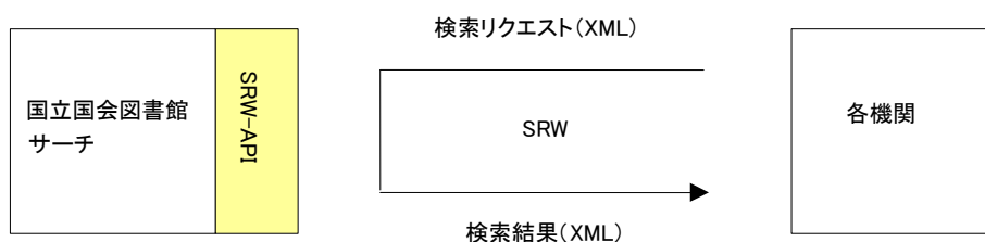
図 4-1 SRW 提供インタフェースの概要

SRU/SOAP(SRW・Search/Retrieve Web Service) (以下、SRW とする) により、外部機関等が本サービスを検索し、結果を取得するためのインタフェースである。