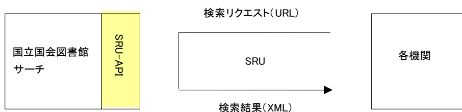
図 3-1 SRU 提供インタフェースの概要

SRU (Search/Retrieve Via URL) により、外部機関等が本サービスを検索し、結果を取得するためのインタフェースである。