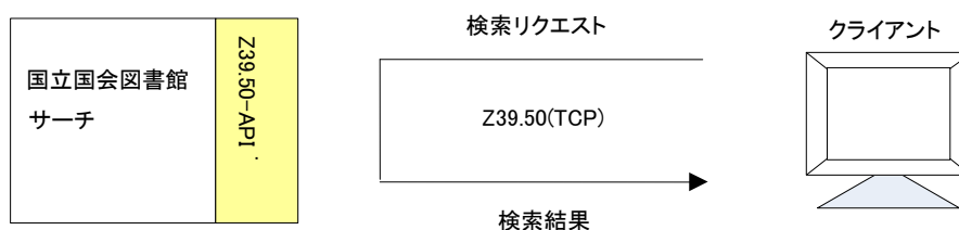
図 7-1 Z39.50 提供インタフェースの概要

Z39.50 により 外部機関等が本サービスを検索し、結果を取得するためのインタフェースである。