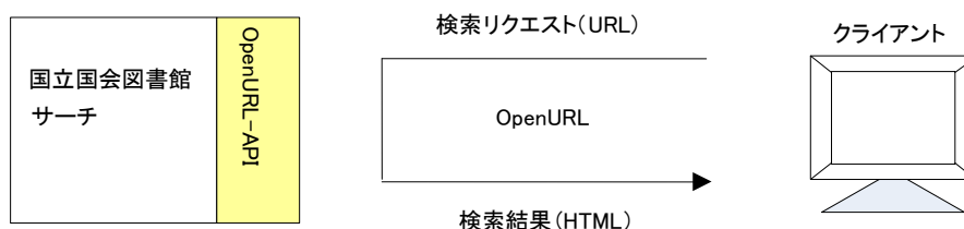
図 6-1 OpenURL 提供インタフェースの概要

OpenURLにより、外部機関等が本サービスを検索し、結果を取得するためのインタフェースである。